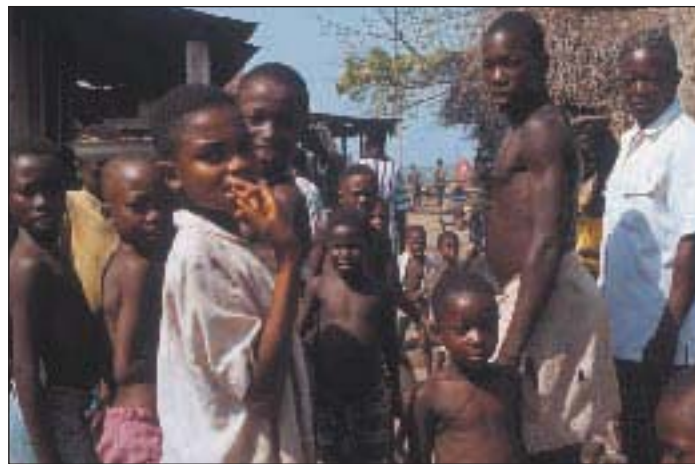
Em cima: O paludismo esgota os recursos comunitários e pessoais, e encerra famílias num ciclo de pobreza implacável. Em baixo: O custo do paludismo—em termos de sofrimento humano—é impossível de calcular.

Conscientes do esgotamento das suas economias, os governos africanos estão agora a aumentar os recursos para lutar contra o paludismo, de acordo com as resoluções tomadas na Cimeira de Abuja de 2000. O paludismo também está a tornar-se um tópico importante em discussões sobre redução da pobreza e remissão de dívida, e a luta contra o paludismo é agora considerada por muita gente como um elemento importante de estratégias nacionais de redução da pobreza para países com paludismo endémico.